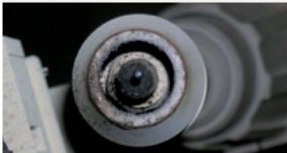
Ero pinnoituksella ja ilman 75 min hitsauksen jälkeen

Aerodag® CERAMISHIELD™ tuotetta markkinoitu aikaisemmin nimellä PULVE BN D 60 A.